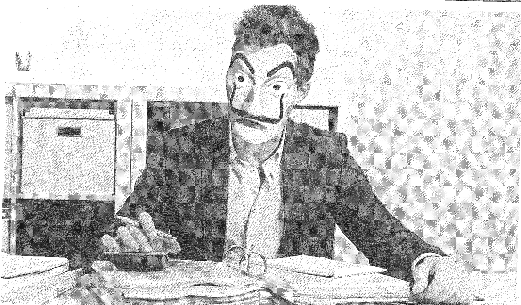
Desprevenidos. Muchas veces, los clientes de un estudio contable no saben si el contador que los atiende tiene título habilitante. (FOTOMATAJE)

El título universitario implica cinco años de estudio, y luego hay